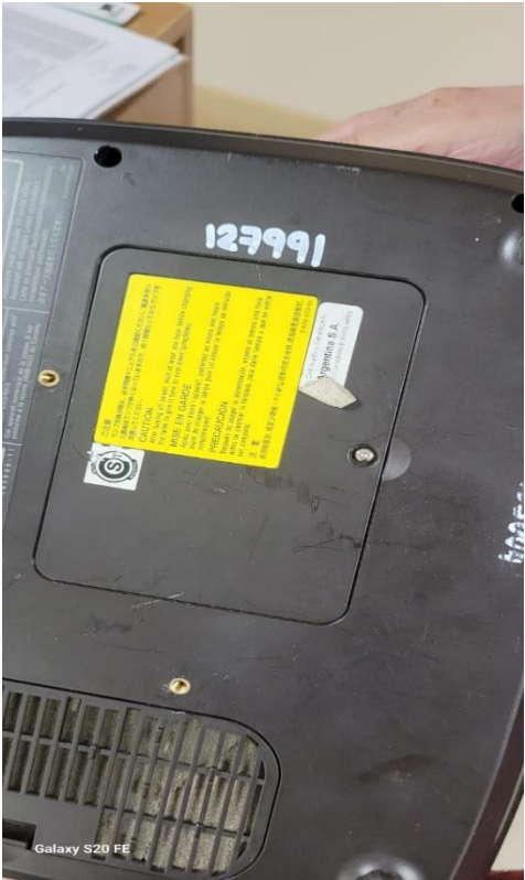
Galaxy S20 FE