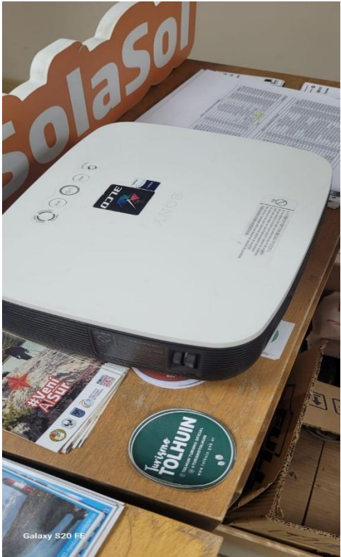
Galaxy S20 FE