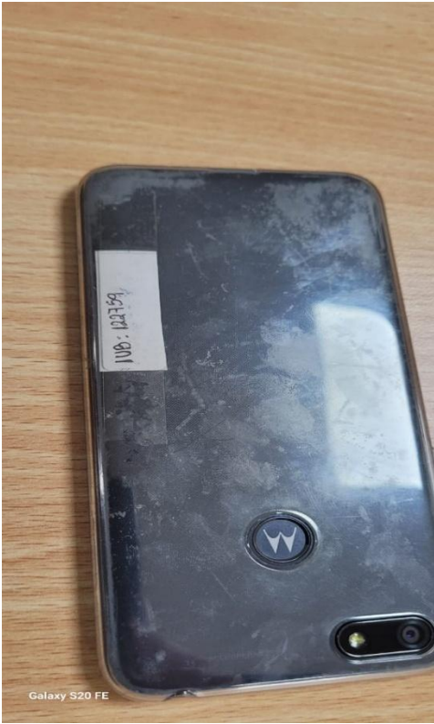
Galaxy S20 FE