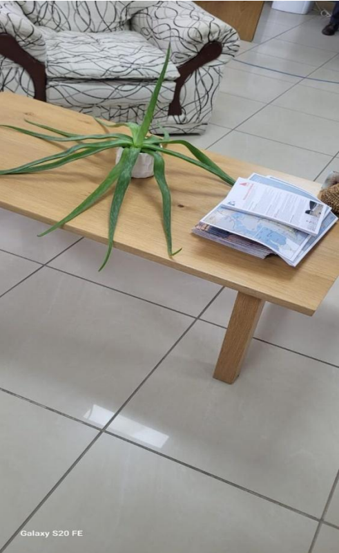
Galaxy S20 FE